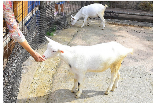
ヤギのフィーディング